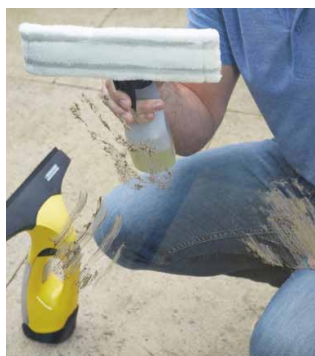
Rozprašovač s mikrovláknovým rozmý- vákem zajišťuje efektivní čištění