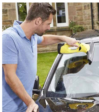
Vysavač čistí okna bez šmouh, kapek a námahy